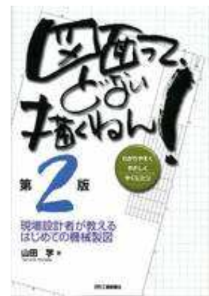
図面って、どない描くねん! 第2版 山田 学著