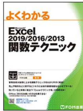
よくわかるExcel 2019/2016/2013 関数テクニック FOM出版