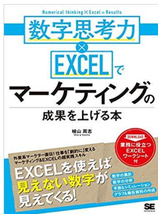
数字思考力×EXCELでマーケティングの成果を上げる本