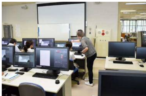
セミナー受講風景(イメージ)