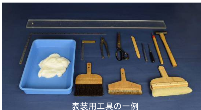
表装用工具の一例