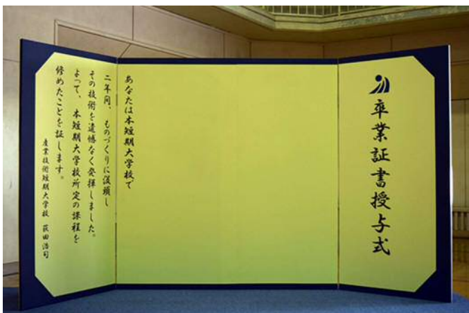
▲「卒業式記念撮影用パネル」(学生卒業製作品)