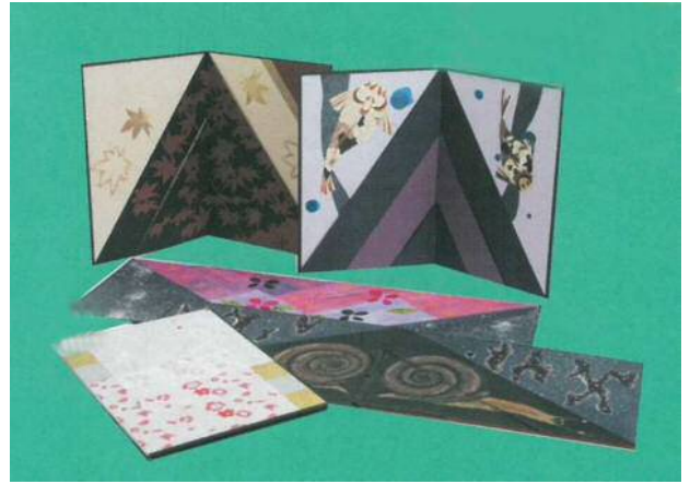
▲「変わり屏風」(学生製作品)

・講習で制作した屏風は、お持ち帰りいただけます。 (お持ち帰りいただける程度の大きさの屏風を制作します。)