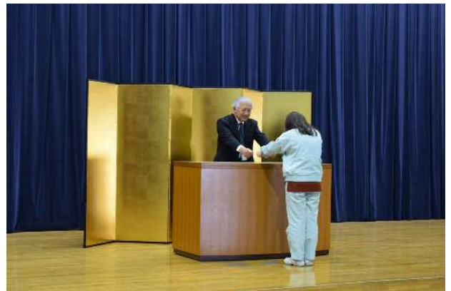
▲「6尺金屏風」(学生卒業製作品)