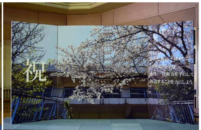
▲「入学式記念撮影用パネル」(学生卒業製作品)