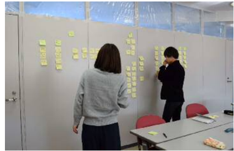
【ワークショップイメージ】